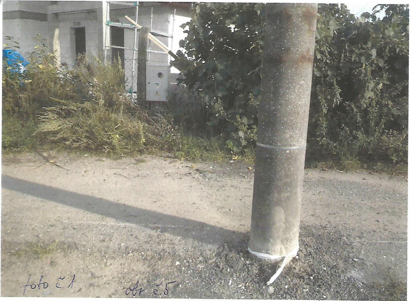
foto č. 1 obr. č. 5