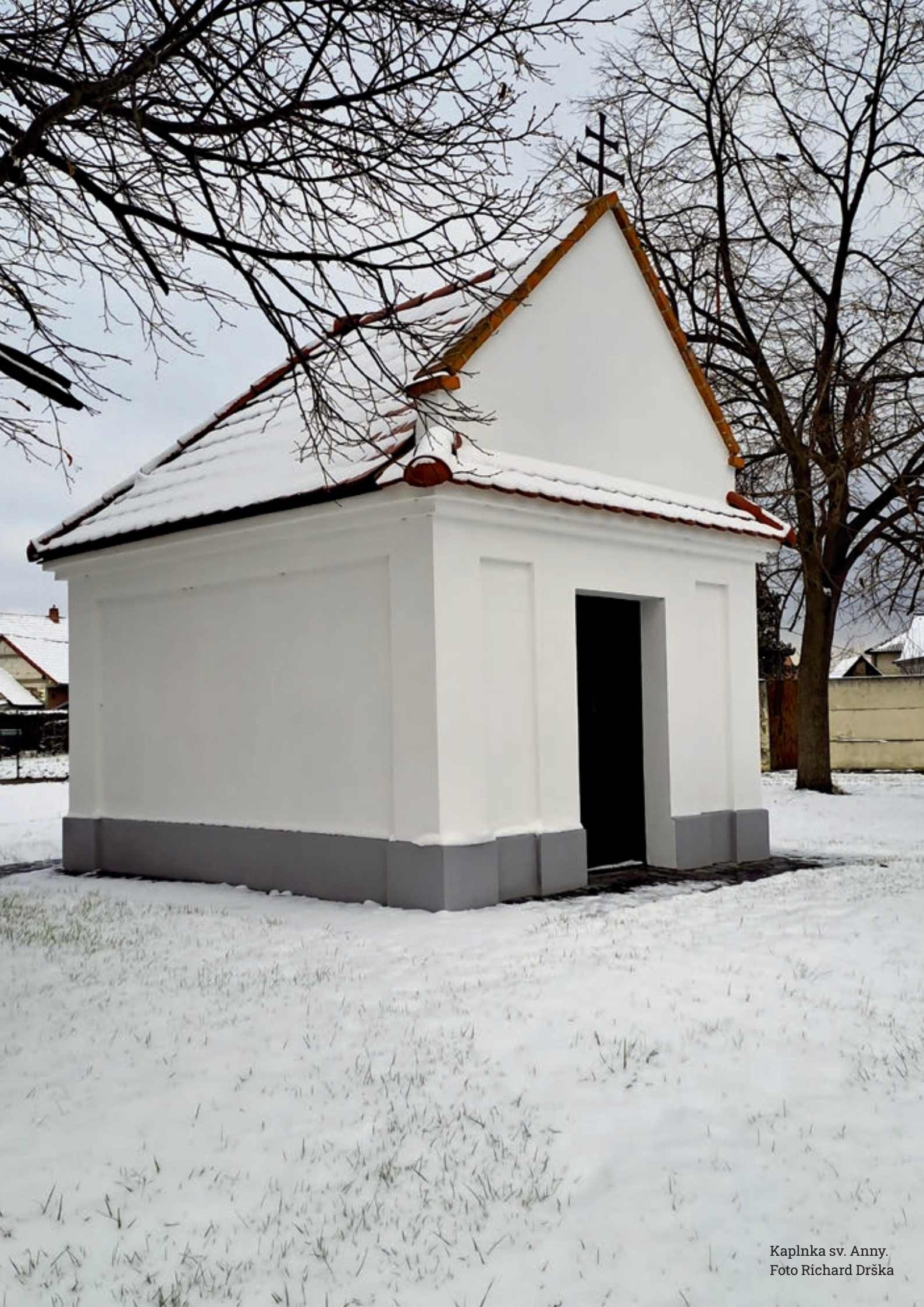
Kaplnka sv. Anny.